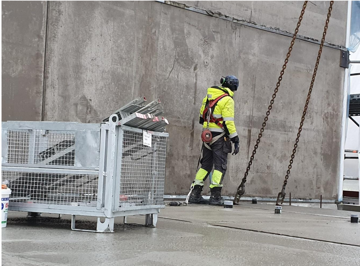
Bild: Montage av väggelement i Kv Gunhild , Brf Porla och Koittra, Spånga.

Utförd med IVL:s förhandsgranskade EPD IVL EPD generator Betong NEPDT28