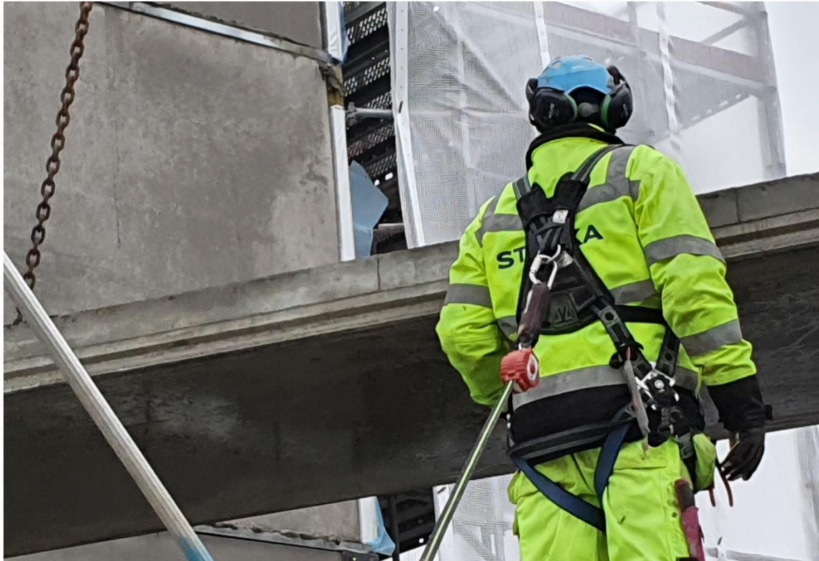
Foto: Montage av förspända plattor i Kvarteret Gunhild , Bfr Porla och Kvittra, Spånga.

Utförd med IVL:s förhandsgranskade EPD IVL EPD generator Betong NEPDT28