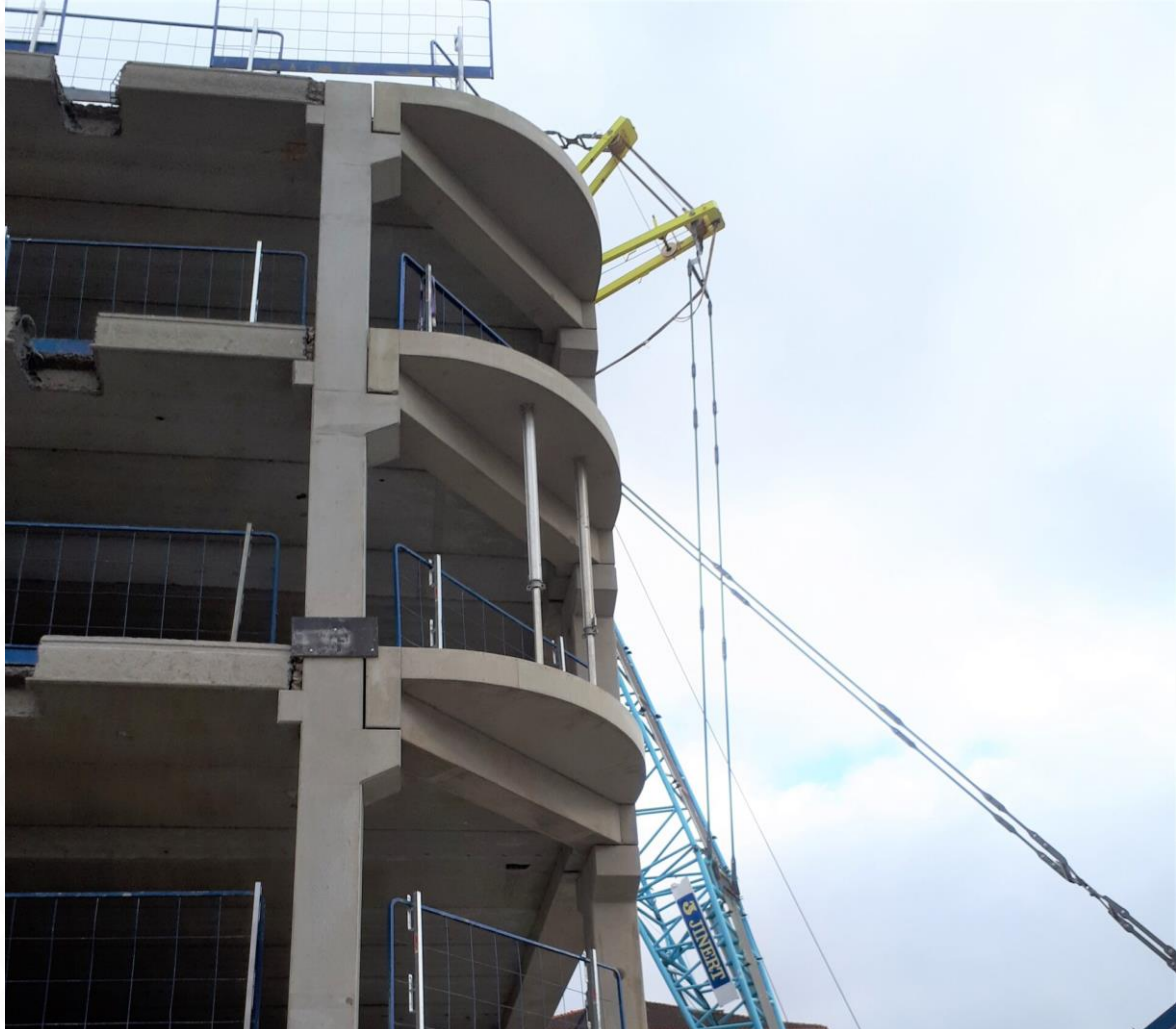
Foto: Östermalms Park , P-hus i Kristianstad.

Utförd med IVL:s förhandsgranskade EPD IVL EPD generator Betong NEPDT28