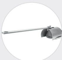
Förlängning kan monteras och Råttstoppen kan monteras även i brunnar med kona.