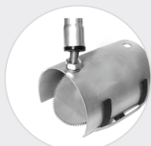
Monteringsstången skruvas på monteringskruven på Råttstoppens ovansida.