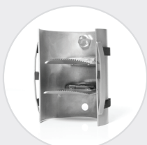
Ett dubbelspjäll med tändstänger av Råttans utgång.