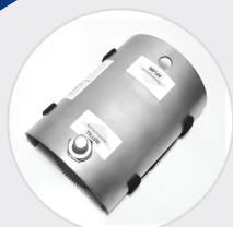
Flyttbar monteringskruv, så Råttstoppen kan användas både till in- och utlopp.

Monteringskruv som fungerar som ett stopp som förhindrar Råttstoppen att komma för långt in i avloppsröret