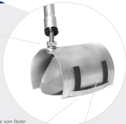
Fjädrar som fäster Råttstoppen i röret.