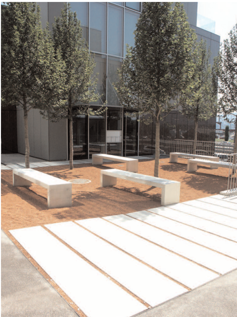
Skräddargjutna plattor för Stadens Golv, parker, trädgårdsgångar, uteplatser m m.